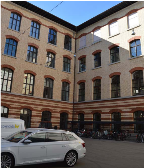
CAB Innenhof Nord