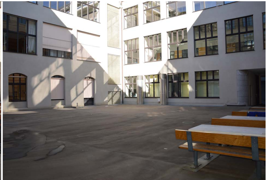
CAB Innenhof Süd

ETH Zürich Abteilung Campus Services Bewilligungen Binzmühlestrasse 130 8092 Zürich