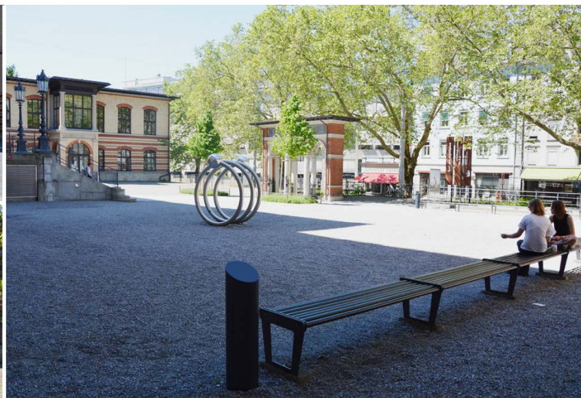
Oben: CAB Kiesplatz links Rampe Unten: CAB Kiesplatz rechts